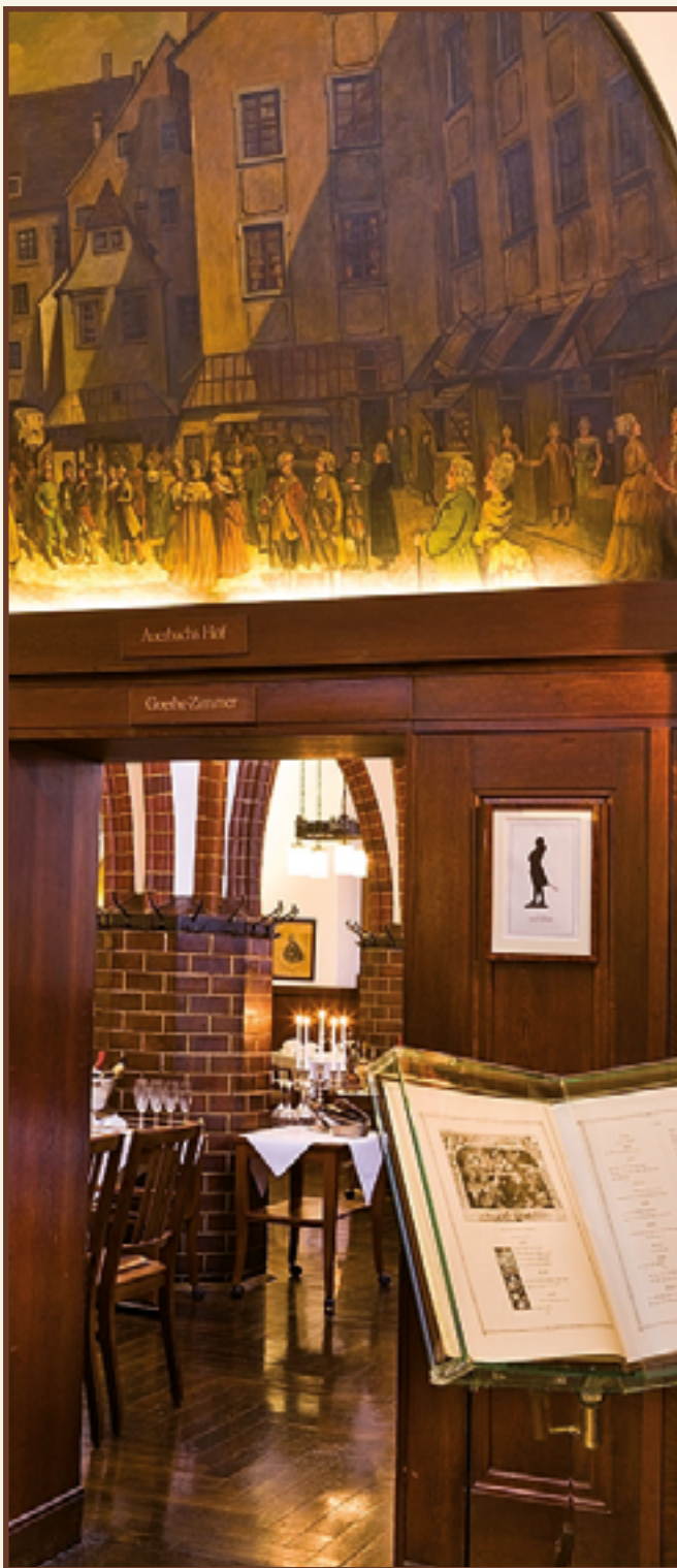
Historische Weinstuben - Blick ins Goethe-Zimmer

Großartiges Erbe, historischer Auftrag und gesellschaftlicher Mittelpunkt – Auerbachs Keller ist 500 Jahre alt!